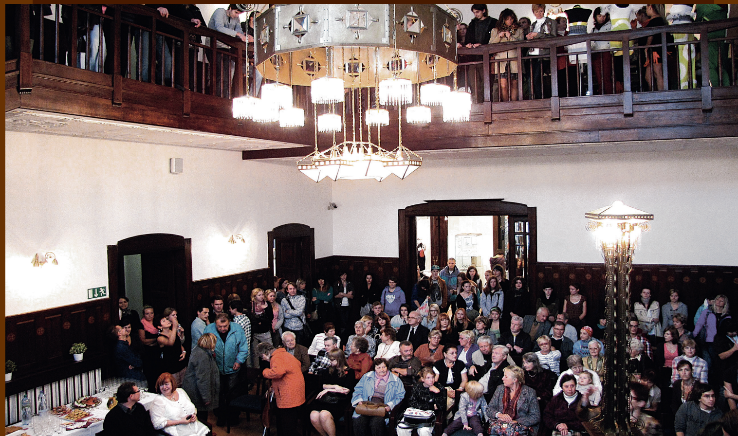
Jedna z mnoha hojně navštívených vernisáží

Naopak menší akce představují cyklus pro dospělé Muzejní kafe a cyklus dětských dílen Cože? ...ale jak? Muzeum nabízí také několik programů pro školy a veřejnost.