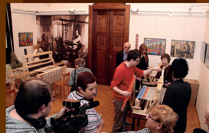
Aby neupadlo v zapomnění textilní řemeslo...