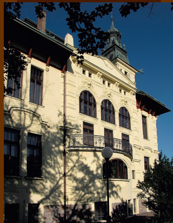
Východní strana Hernychovy vily

Sbírkový fond městského muzea čítá na 43 tisíc evidenčních čísel, z nichž nejpočetnější část tvoří písemnosti, fotografie a betlémy. Tematicky důležitý je i hudební fond, obsahující dokumenty např. k Jaroslavu Kocianovi nebo Bohuši Heranovi. Jmenovat musíme i sbírky textilu a řemesel úzce spjatých s dřívější obživou obyvatel zdejšího regionu. Další sbírky (knihy, etnografie, výtvarné umění a místní památky) doplňují obrázky o historii a národopisu města a jeho blízkého okolí. Každoročně tak odchází spokojení návštěvníci přibližně z deseti výstav a více jak třiceti akcí, z nichž k největším patří Muzejní noc, Strojní oustecká sobota nebo Poutí na zahradě Hernychovy vily.