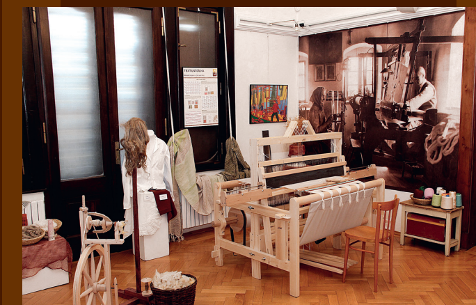
...je veřejnosti k dispozici řemeslná textilní dílna