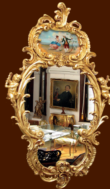
Zrcadlo z pamětní síně Jaroslava Kociána