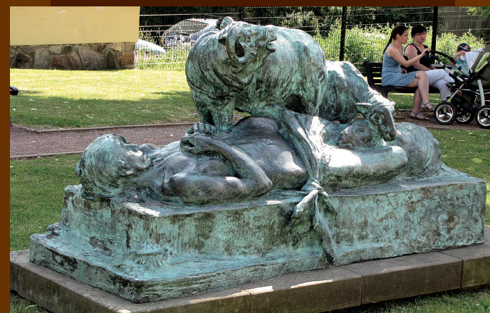
Mrtvý Ábel od T. Q. Kociána

Pokud si v muzeu chcete užít něco neobvyklého, máme pro Vás k dispozici řemeslnou textilní dílnu s kolovratem, třemi stavý a řadou drobných předmětů. Na nich si můžete vyzkoušet předení, skaní, tkaní, ale třeba i ruční stáčení provázků.