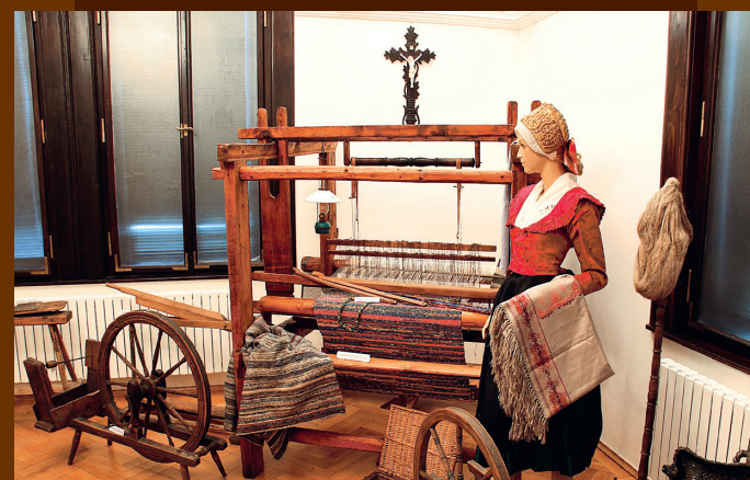
Historii textilní výroby připomíná malá expozice

Ve 20. letech minulého století se sbírky mnohonásobně zvětšily a muzeum se přestěhovalo do větších prostor. Tomuto účelu vyhovovala budova