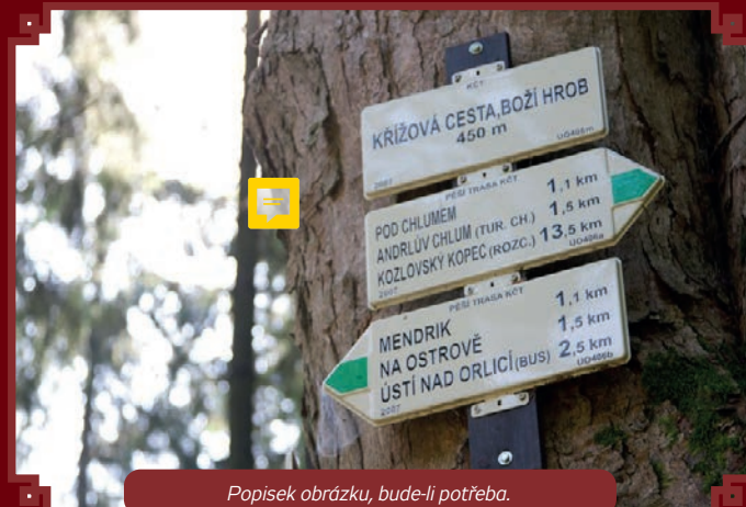
Popisek obrázku, bude-li potřeba.

Původní zastavení Křížové cesty tvořily malé pískovcové objekty s kamenným klekátkem a obrazem. Z této první Křížové cesty se nám zachovalo jediné